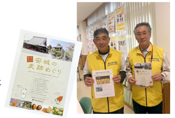
安城ふるさとガイドの会 http://kikakubito.net/guide/

安城市観光案内所(キーポート)、歴史博物館、市内の公民館、福祉センター、わくわくセンターなどに置いてあります。