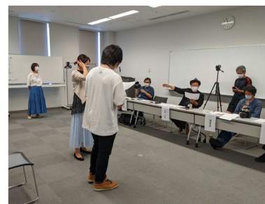
▲オーディションの風景